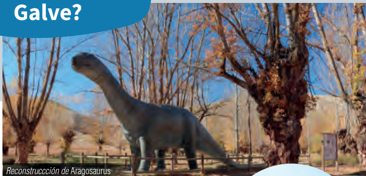
Reconstrucción de Aragosaurus

Galve es un municipio de gran tradición e importancia paleontológica desde hace décadas. En el denominado Parque Paleontológico son visitables los yacimientos de icnitas de dinosaurios Las Cerradicas (junto a la carretera de acceso al pueblo) y Los Corrales del Pelejón (tras recorrer 4,5 km por pista de tierra), así como algunas reconstrucciones de los “lagartos terribles” en la chopera del río Alfambra.