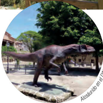
Alosáurido en el DINOpaseo

El Castellar está enclavado en un impresionante entorno natural de la Comarca de Gúdar-Javalambre. Se puede disfrutar del DINOpaseo (un recorrido de un kilómetro a pie por las calles del pueblo, donde se muestra la diversidad paleontológica del municipio a través de réplicas y esculturas, que finaliza en la denominada Alberca del Saurio ).