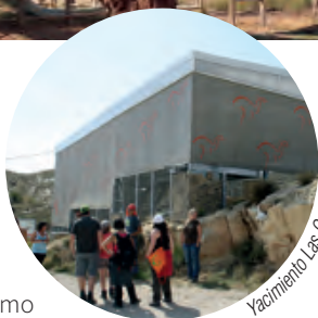
Yacimiento Las Cerradicas

Galve es un municipio de gran tradición e importancia paleontológica desde hace décadas. En el denominado Parque Paleontológico son visitables los yacimientos de icnitas de dinosaurios Las Cerradicas (junto a la carretera de acceso al pueblo) y Los Corrales del Pelejón (tras recorrer 4,5 km por pista de tierra), así como algunas reconstrucciones de los “lagartos terribles” en la chopera del río Alfambra.