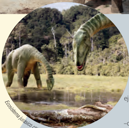
Ecosistema jurásico con saurópodos

El recorrido discurre especialmente por un entorno geológico de los periodos Jurásico y Cretácico, por lo que los fósiles de la ruta permiten reconstruir algunas escenas del pasado como, por ejemplo, a diversos dinosaurios carnívoros acechando a manadas de saurópodos –cuadrúpedos con cuello y cola largos–, estegosáuridos –con placas dérmicas desde el cuello hasta el final de la cola– y ornitópodos.