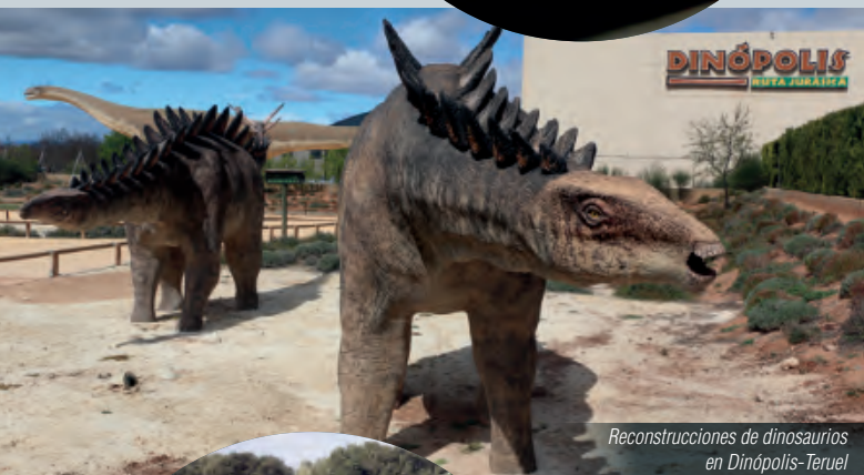
Reconstrucciones de dinosaurios en Dinópolis-Teruel