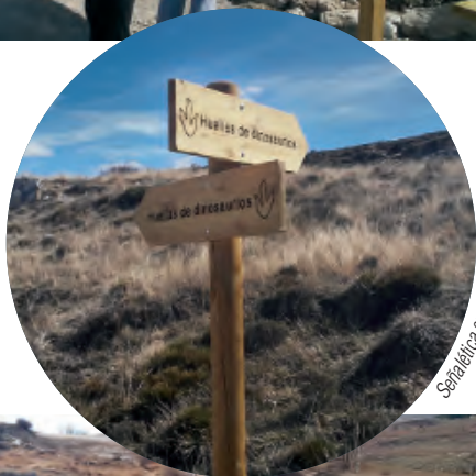
Señalética en Ababuj

El yacimiento Ababuj se sitúa en los márgenes de la carretera que lleva desde el pueblo hasta Aguilar del Alfambra.