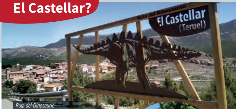
Ruta del Dinosaurio

El Castellar está enclavado en un impresionante entorno natural de la Comarca de Gúdar-Javalambre. Se puede disfrutar del DINOpaseo (un recorrido de un kilómetro a pie por las calles del pueblo, donde se muestra la diversidad paleontológica del municipio a través de réplicas y esculturas, que finaliza en la denominada Alberca del Saurio ).