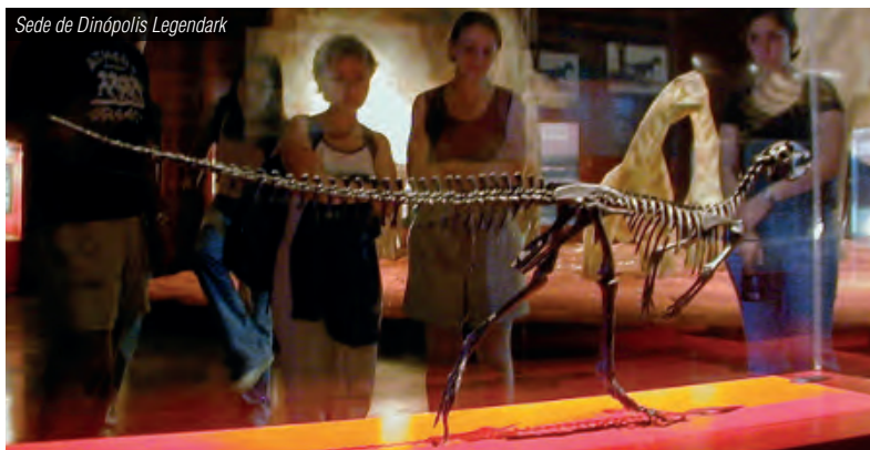
Sede de Dinópolis Legendark