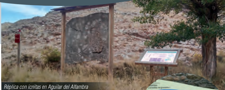
Réplica con icnitas en Aguilar del Alfambra

paleontológicos para visitar en esta ruta