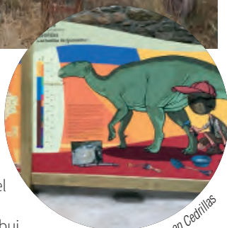
Dinoexperience en Cedrillas

La relación de la Comarca Comunidad de Teruel con los dinosaurios queda patente también en diversa señalética instalada en esta ruta en Ababuj y Cedrillas. Todo ello está incluido dentro del proyecto comarcal denominado Dinoexperience .