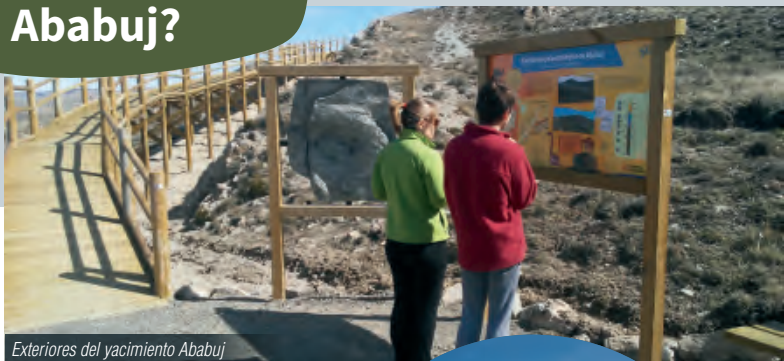
Exteriores del yacimiento Ababuj

El yacimiento Ababuj se sitúa en los márgenes de la carretera que lleva desde el pueblo hasta Aguilar del Alfambra.